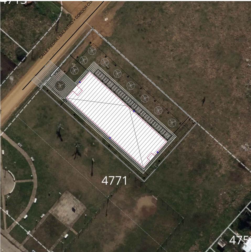
FOTO ÁEREA ESC 1_750