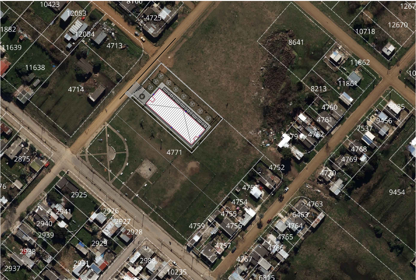
FOTO ÁEREA ESC 1_1500